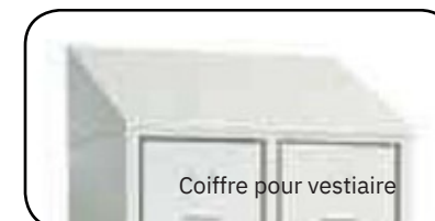
Coiffre pour vestiaire