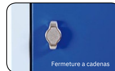
Fermeture a cadenas